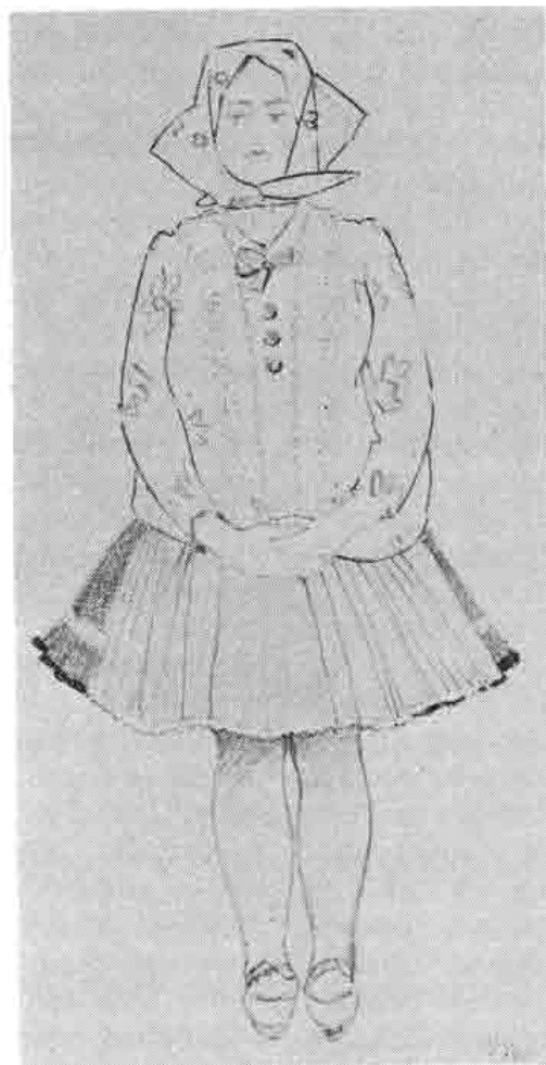
Ludovít Fulla, Ženská krojová štúdiá zo Zemplína. Kresba 1942—1943

Struktur der Familienerziehung im Dorf von Grund auf verändert, sie nähert sich dem Modell der Familienerziehung in der städtischen Umwelt. Im Laufe der Arbeit beim gemeinschaftlichen Wirtschaften entstehen neue Werte, es tauchen auch neue Probleme auf, aber gleichzeitig werden auch die Voraussetzungen für die Befriedigung der materiellen und geistigen Bedürfnisse der Menschen geschaffen.